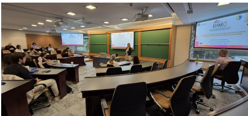
Vortrag am ersten Tag

Am ersten Kongresstag hielt ich einen Vortrag zum Thema „Improving maternal care through communication: Insights on satisfaction and perceived safety“ . Dieser Beitrag adressierte den Kongressschwerpunkt people-centred systems und untersuchte den Einfluss von Kommunikation auf Zufriedenheit und Sicherheit in der Geburtshilfe. Die Ergebnisse unterstreichen die zentrale Bedeutung von empathischer Kommunikation, klarer Information und Patient:innenbeteiligung für eine qualitativ hochwertige Versorgung.