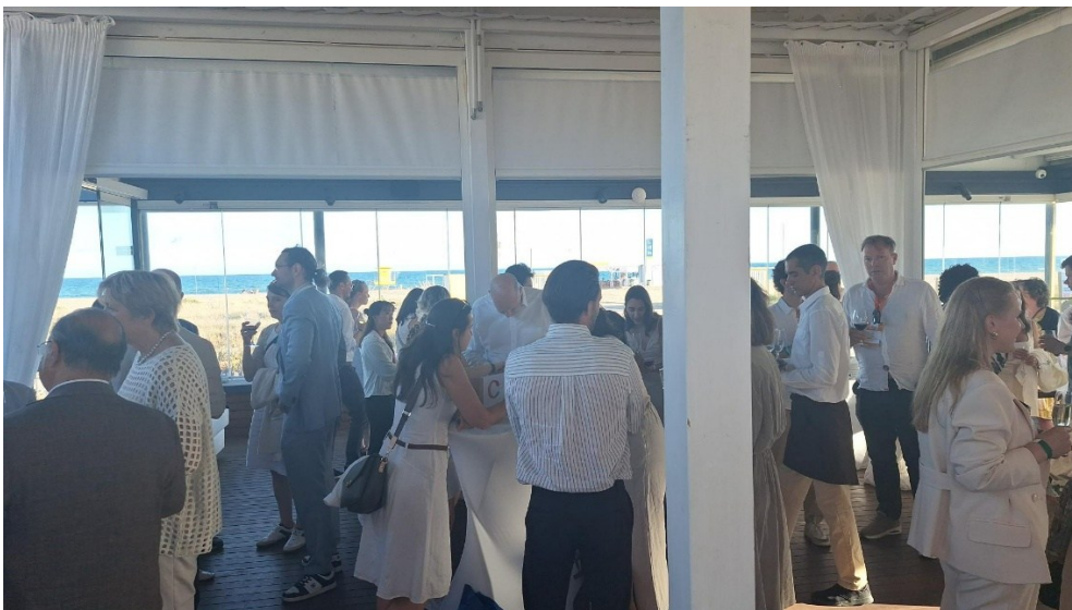
Social Dinner im Fete Blanche Stil