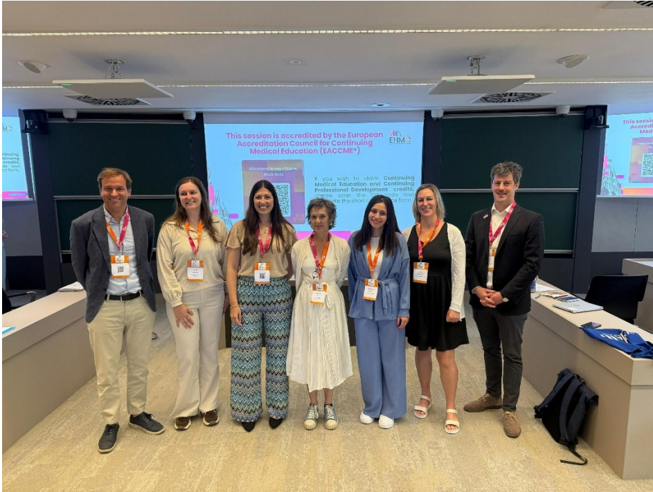
Vortrag am zweiten Tag

Am Abend fand ein Social Dinner am Strand von Barcelona statt, bei dem die fachlichen Diskussionen des Tages weiter vertieft werden konnten.